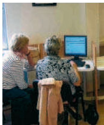
Un accès pour tous. ■ E.J.

"Les participants ont enregistré la lecture à voix haute d'un premier roman, à destination des mal-voyants. Pour ces apprenants qui ont donné leur voix à un livre, c'est une grande joie de savoir que leur travail sert à des personnes qui vivent un handicap." Ces ateliers seront reconduits dès janvier prochain et s'inscrivent dans une démarche de proximité avec tous les lecteurs: en effet, la bibliothèque de Mouscron est forte de sept antennes dont une à la Régie de quartier des Blommies et une