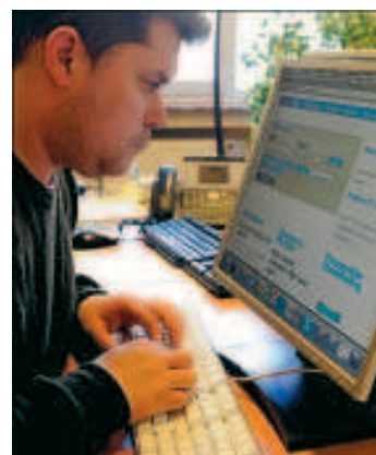
Aussi apprendre à manier le net.